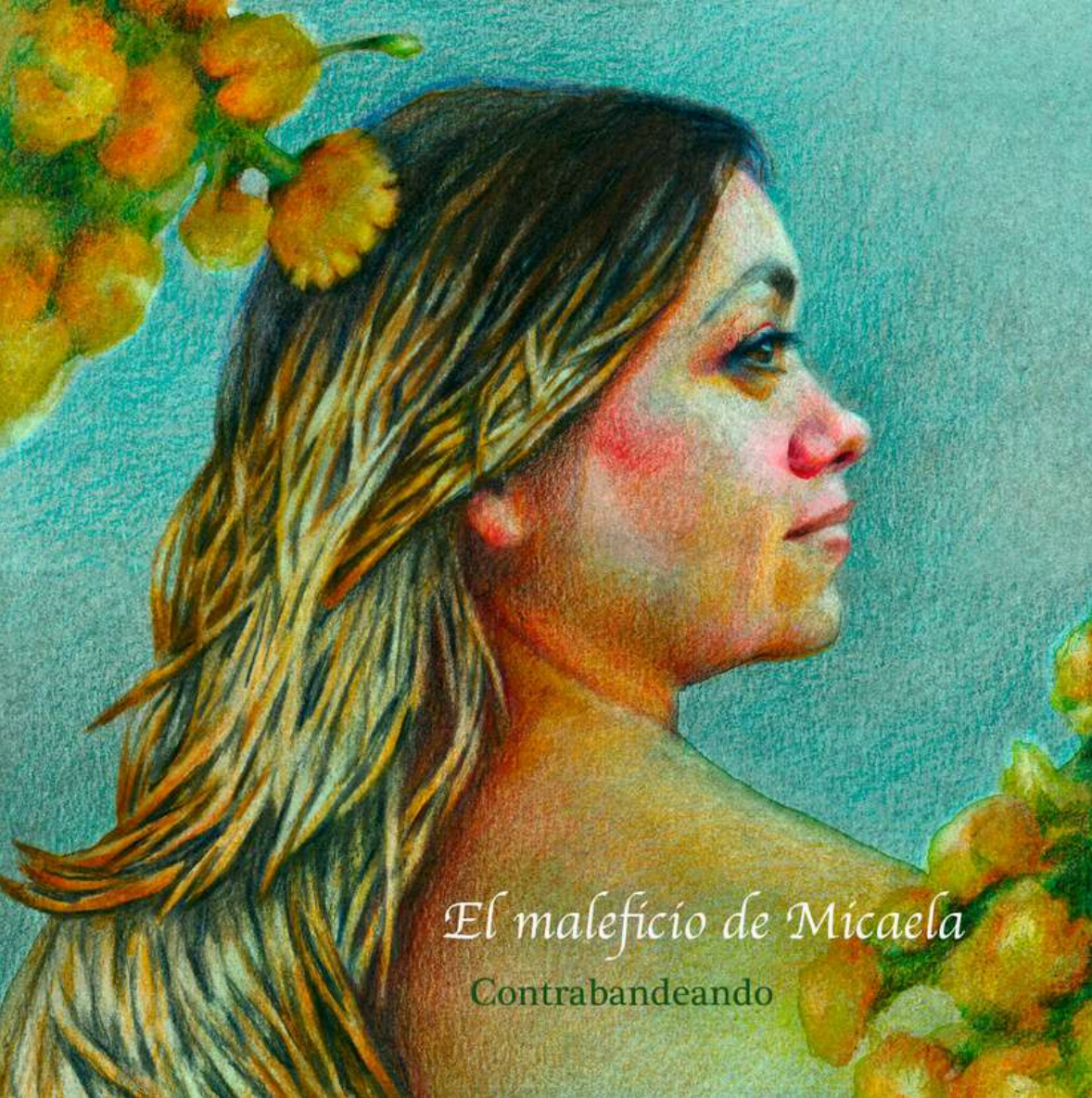
El maleficio de Micaela Contrabandeando